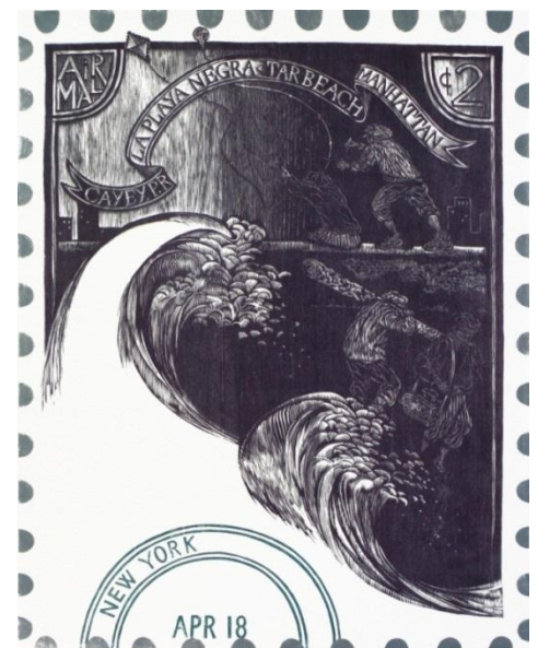
Niño jugando con su papalote sobre la playa negra y dos hombres en plena faena.